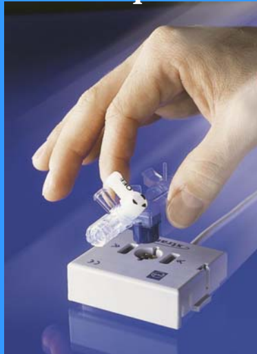
16, 17, 18 octobre 2007 Nantes