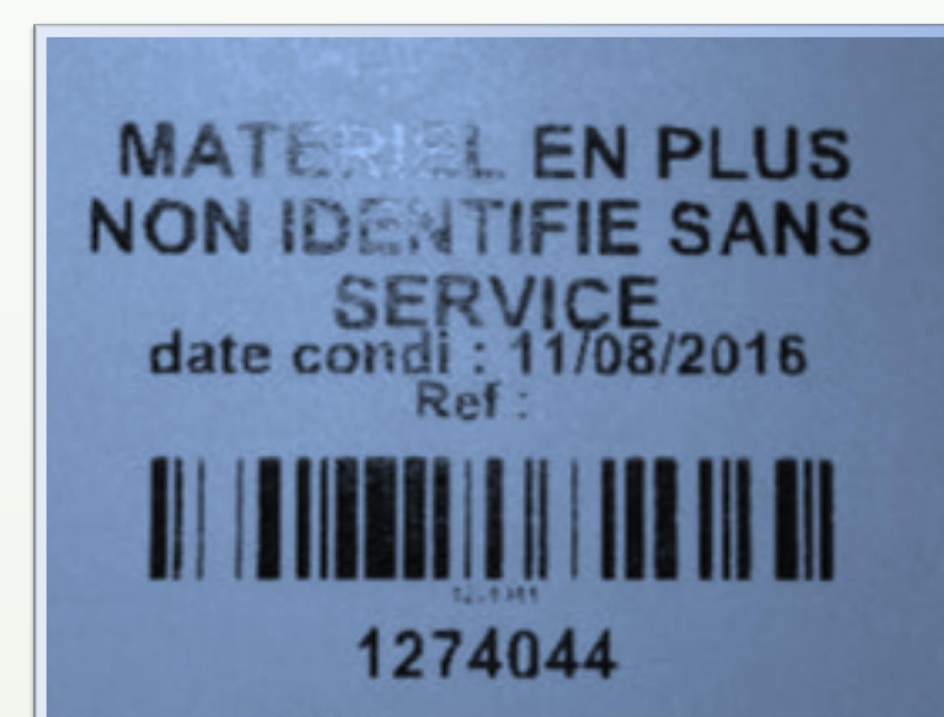
Exemple d'étiquette de traçabilité pour un INIOI