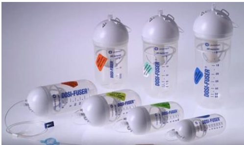
Figure 2 : Modèles de diffuseurs portables

Les diffuseurs portables sont des dispositifs médicaux externes, stériles, à usage unique, non programmables et indépendants de toute source d'énergie. Le réservoir est constitué d'une membrane élastomérique, le plus souvent enfermée dans une