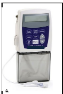
Figure 3 : Modèle de pompe à perfusion

Les pompes à perfusion sont des dispositifs médicaux programmables et actifs. Le réservoir d'administration peut être une poche ou une cassette. Plusieurs modèles de pompes sont disponibles sur le marché, présentant chacun des spécificités en matière de réglage de débit, de débits limites (maximum et minimum) et d'alarmes de contre-pression. Elles permettent